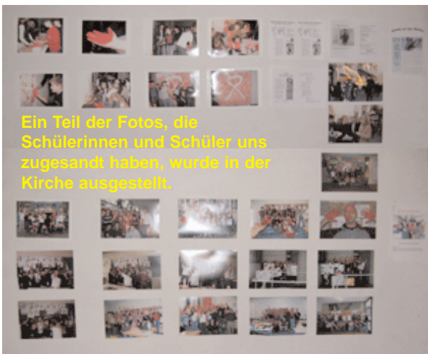
Ein Teil der Fotos, die Schülerinnen und Schüler uns zugesandt haben, wurde in der Kirche ausgestellt.