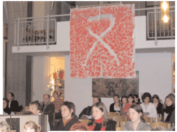
Die 700 Schülerinnen und Schüler der Realschule Kerpen haben das zentrale Bild der Aktion Rote Hand 2005 geschaffen: 700 rote Hände ergaben dieses Tuch.